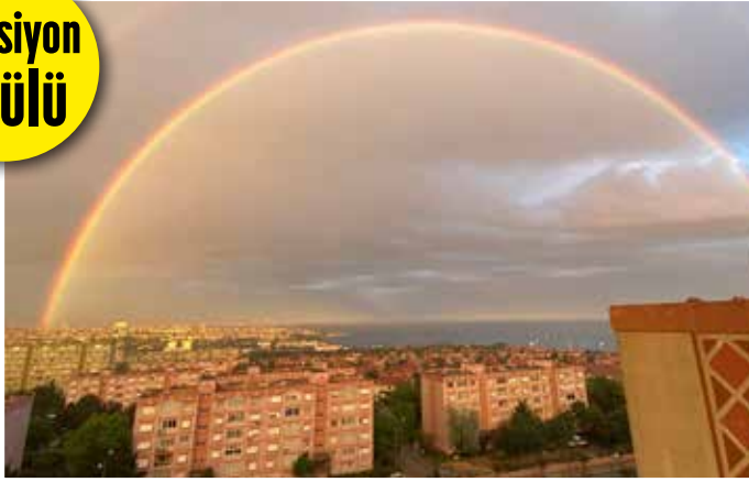
RUMUZ KARADENİZ KIZI